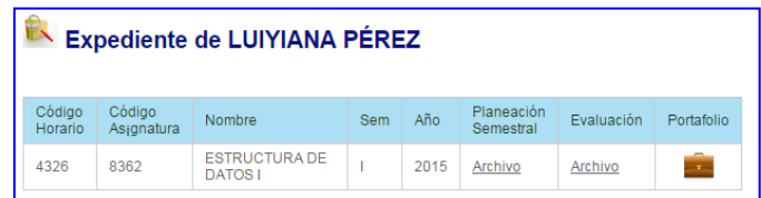
Fig. 1. Expediente que se genera para un docente en un curso determinado, vista por una autoridad académica.

Cada uno de los actores tiene un rol determinado con funciones específicas, validado por clave de acceso. Un docente puede registrar las evaluación cuantitativa de las diferentes actividades académicas planificadas durante el semestre, con el fin de recoger, a través de un portafolio en línea, la efectividad de la metodología utilizada en un curso, sustentado en archivos históricos de exámenes, trabajos, laboratorios, material didáctico y evaluaciones, que dan evidencia de la labor docente, así como del rendimiento académico de los estudiantes.