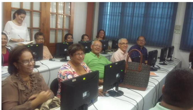
Fig. 4. “Sesiones de capacitación en el Centro Regional de Azuero”.

El impacto de SIESA puede visualizarse desde tres puntos de vista, el estudiante, el docente y la organización académica; en la medida en que los resultado contribuyan a tomar mejores decisiones sobre el proceso de enseñanza – aprendizaje; se garantice eficientemente su usabilidad por cada uno de los actores involucrados; y se alineen a los requerimiento de los procesos de re-acreditación, su impacto será positivo.