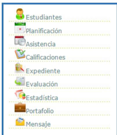
Fig. 2. “Menú del docente”.

8) Mensaje : medio de comunicación asíncrono entre los estudiante de un curso con el docente.